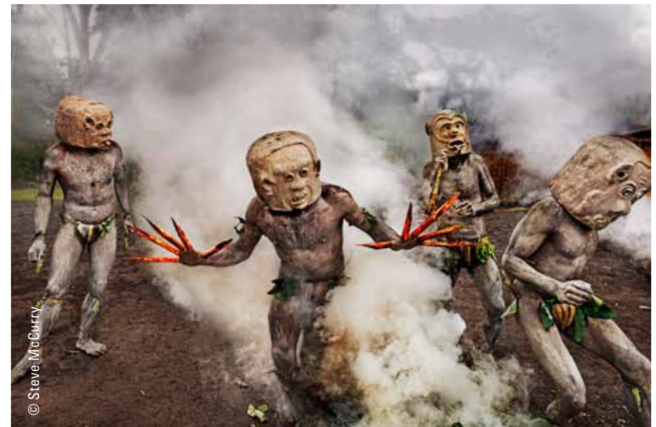
Papua New Guinea, 2017