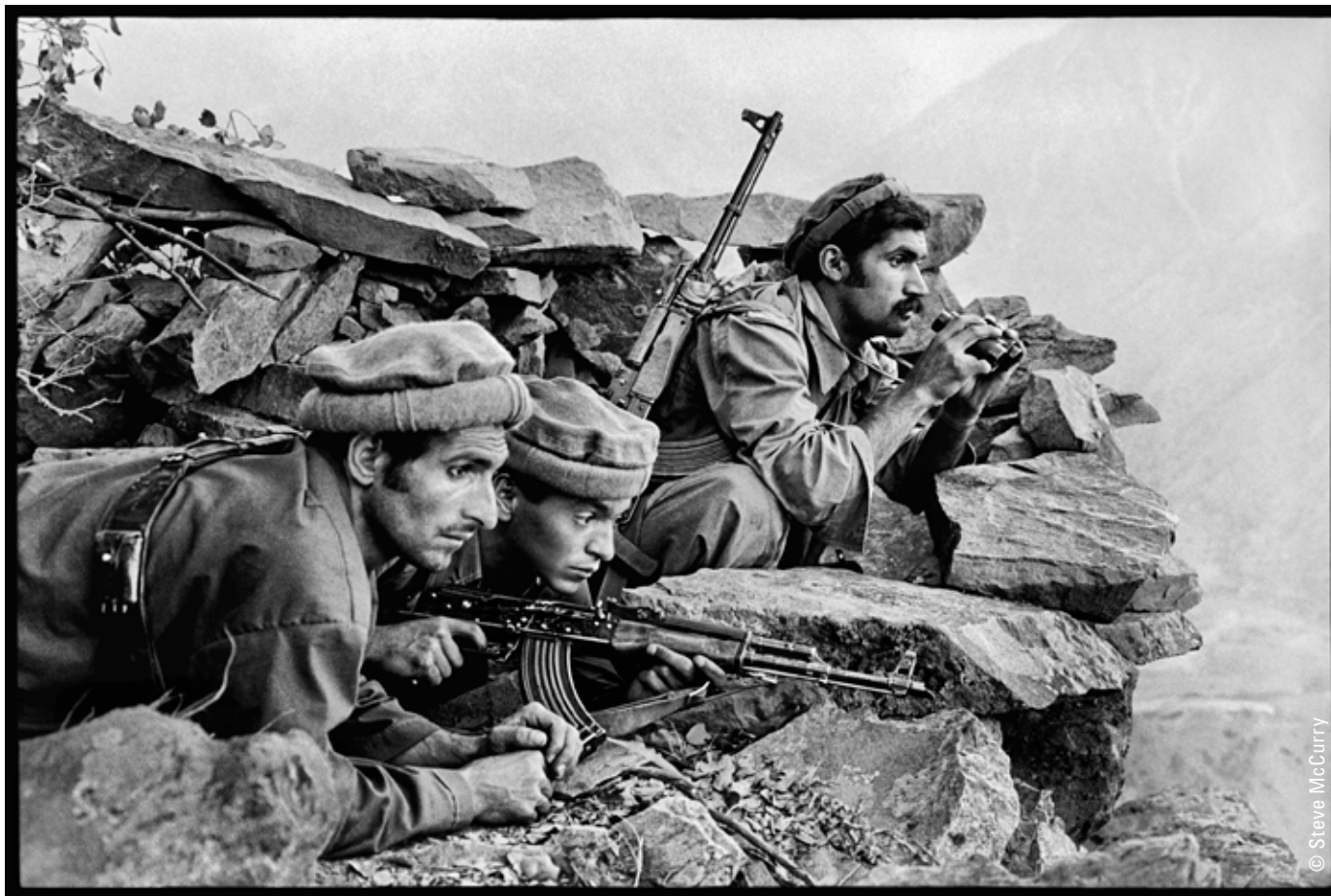
Nuristan, Afghanistan, 1979

Ce groupe de Mujahidin s'est arrêté sur une corniche rocheuse en haut des montagnes pour observer et suivre un convoi de soldats sur la route, loin en contrebas.