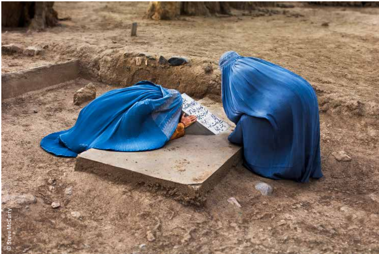
Bamiyan, Afghanistan, 2007

Deux femmes Hazara en deuil devant une tombe. Des décennies de guerre ont fait au moins deux millions de veuves qui luttent pour gagner leur vie et nourrir leurs enfants.