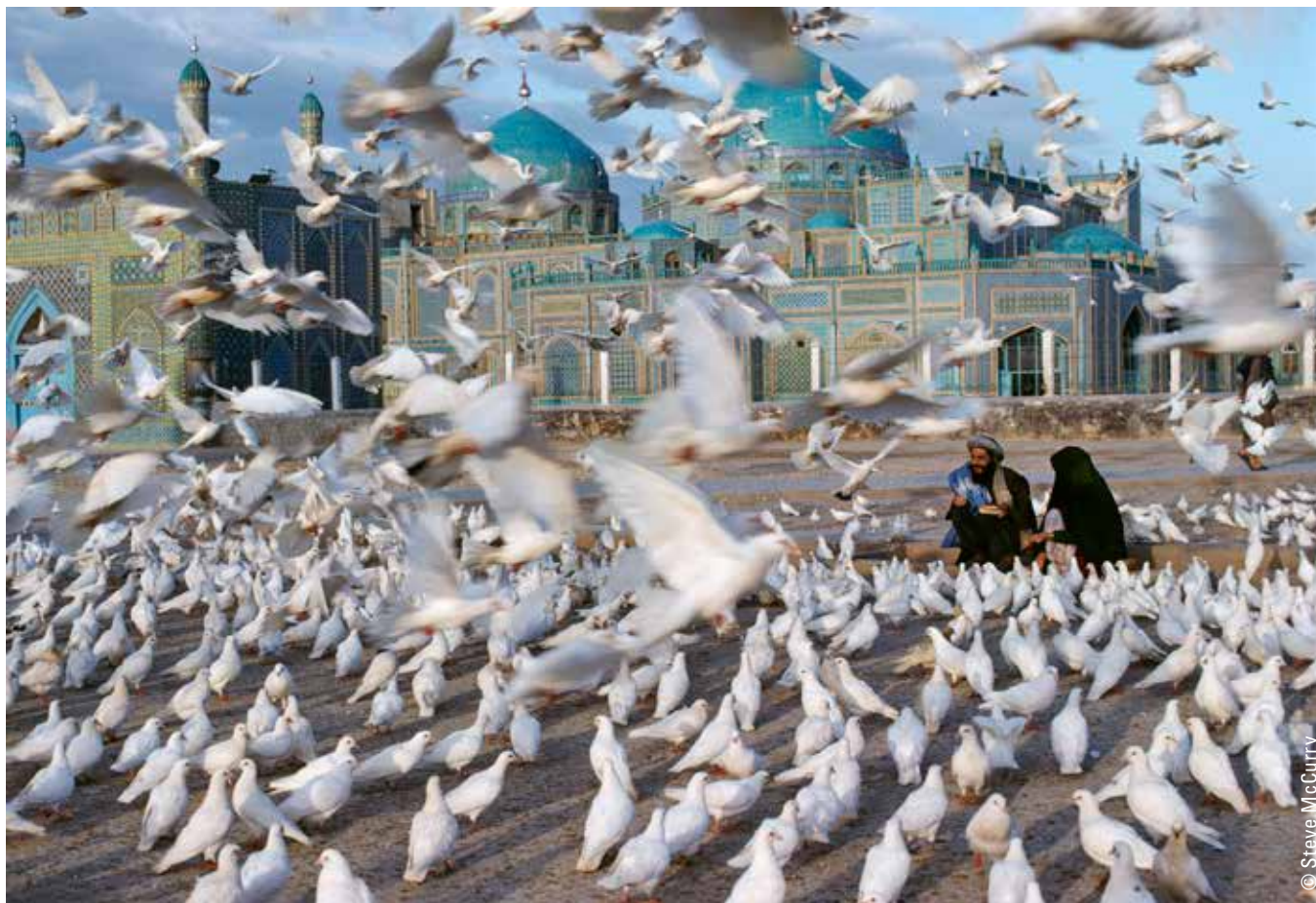
Mazar-i-Sharif, Afghanistan, 1991

Des colombes devant la « Mosquée bleue » de Mazar-i-Sharif, le tombeau de Hazrat Ali. Les colombes blanches sont souvent nourries par les pèlerins qui visitent ce lieu saint.