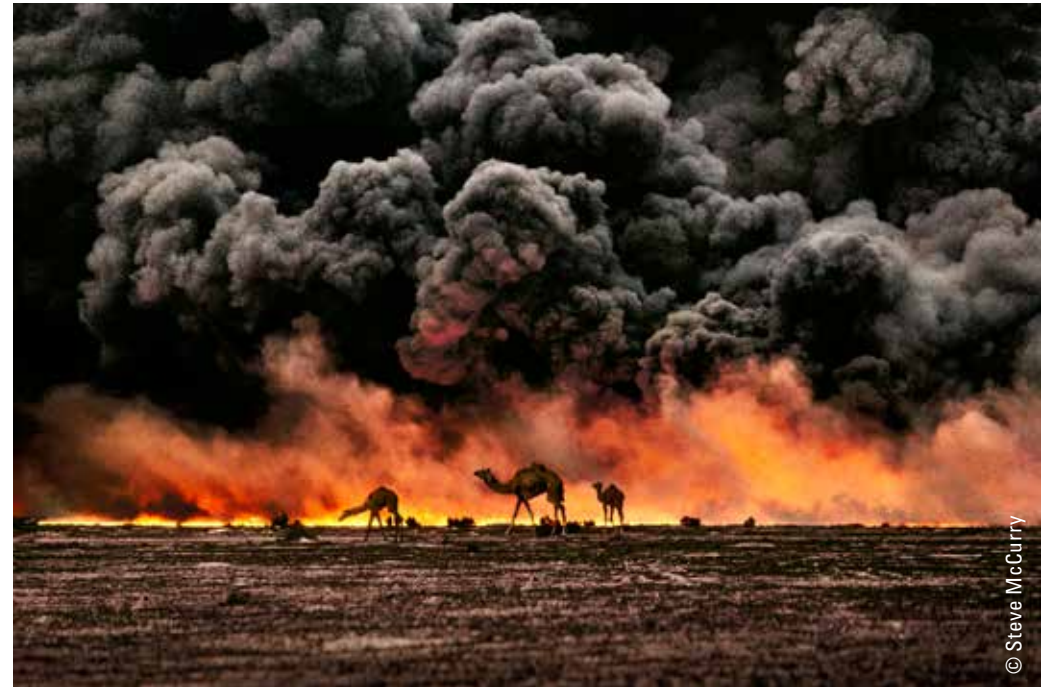
Al Ahmadi oil field, Kuwait, 1991